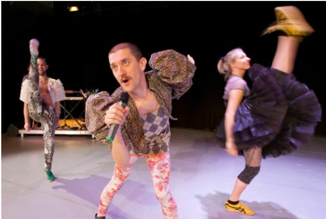
NAVARIDAS/DEUTINGER. Your own personal circus.