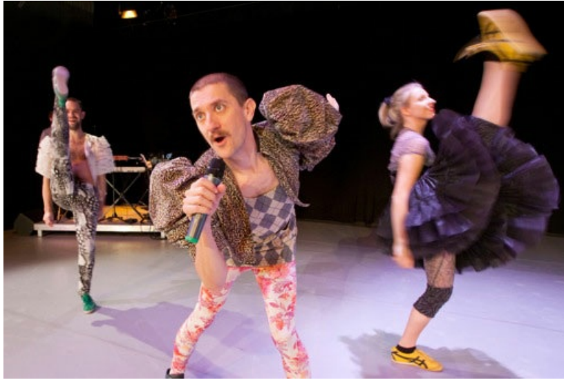
NAVARIDAS/DEUTINGER. Your own personal circus.