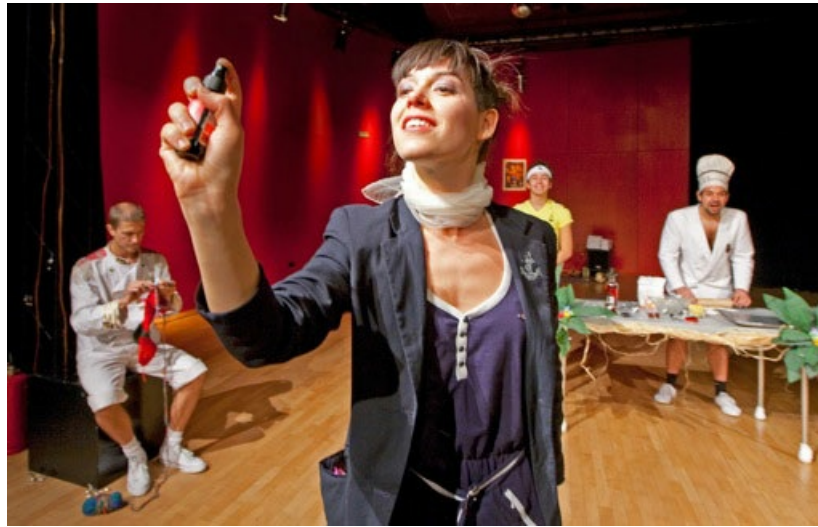
NAVARIDAS/DEUTINGER. This Is Not A Ship.