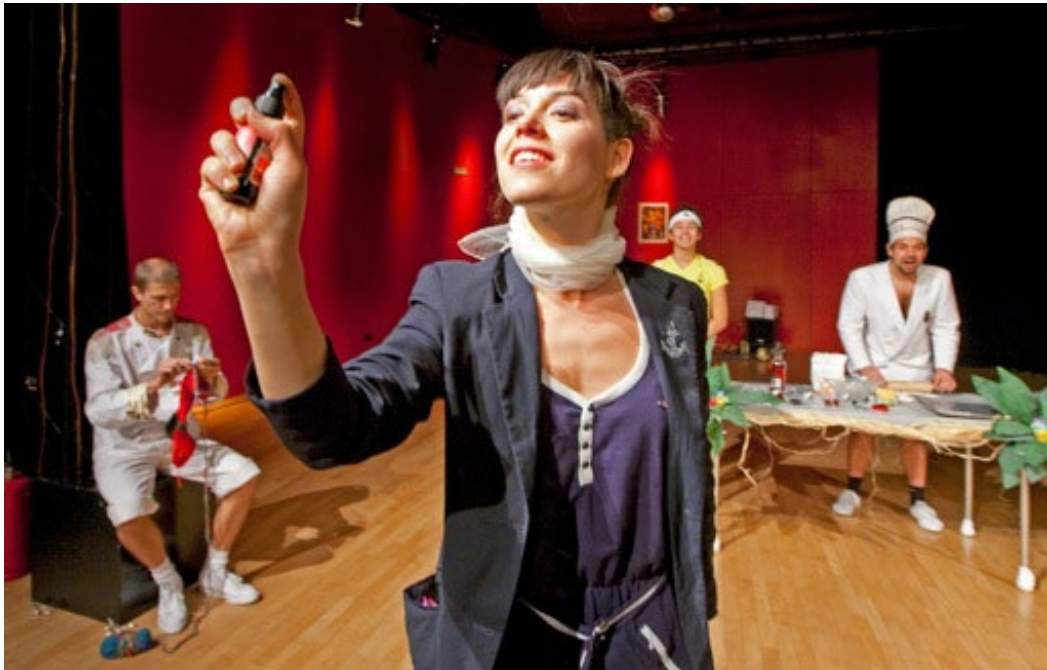
NAVARIDAS/DEUTINGER. This Is Not A Ship.