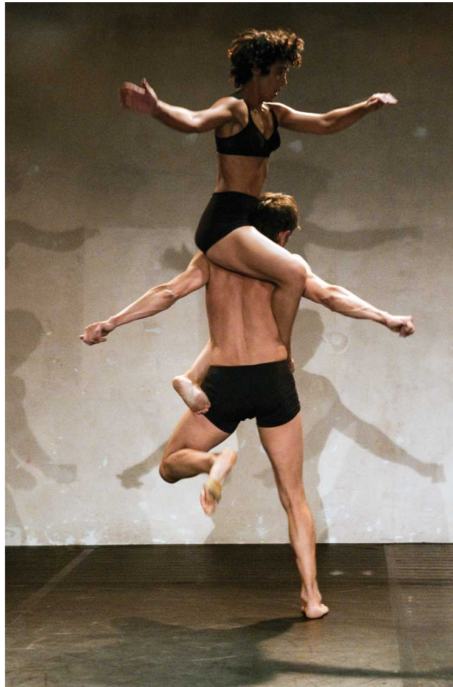
Carni di prima qualità. Mov[i]Ment #1. Festival Grec (2010)