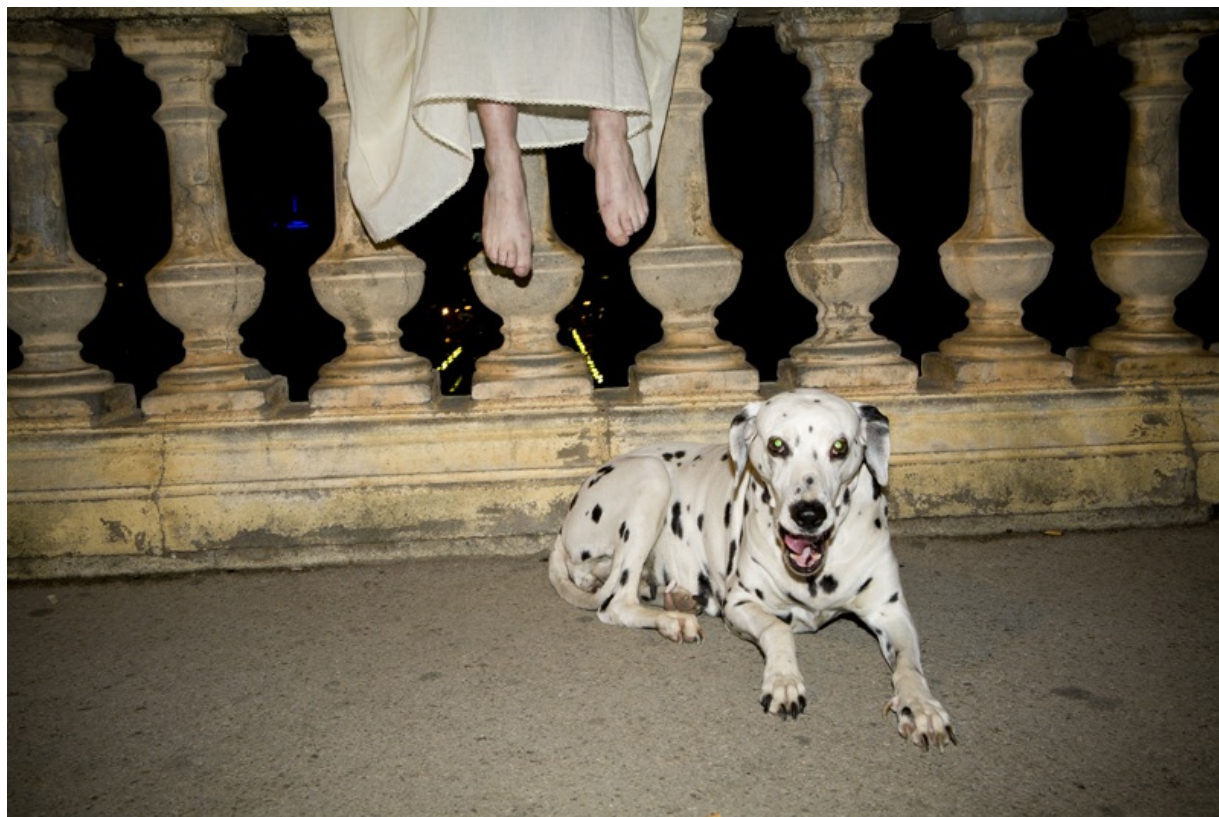
Candela - by Inma Varandela