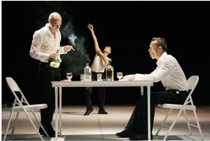
"Grand Prix du Syndicat de la Critique" pour la saison 2006-2007