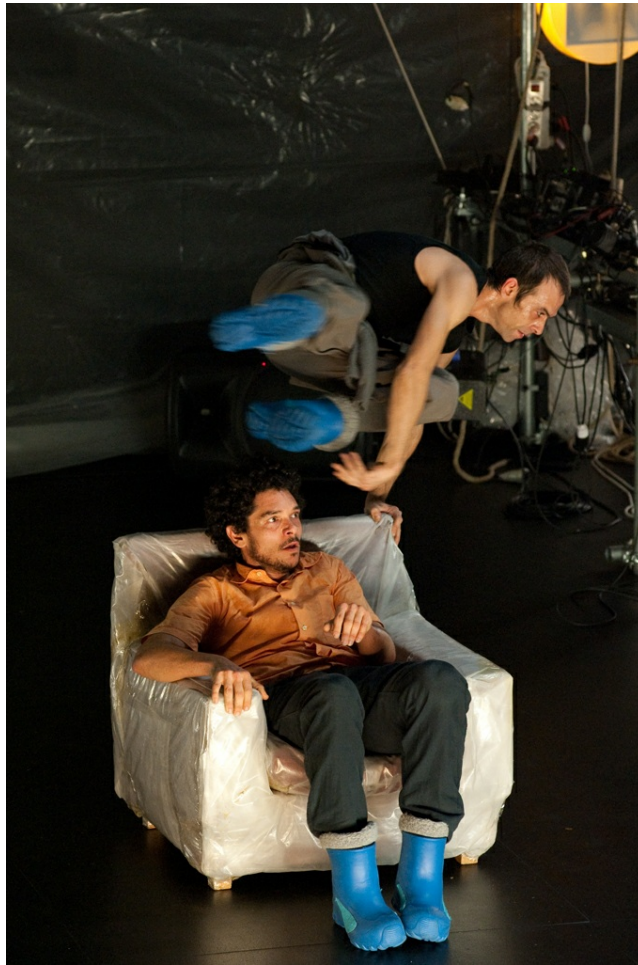
El cel dels tristos (2011)