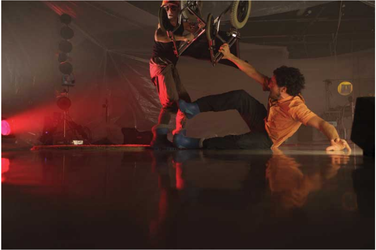
El cel dels tristos. PanoraMix (2012)