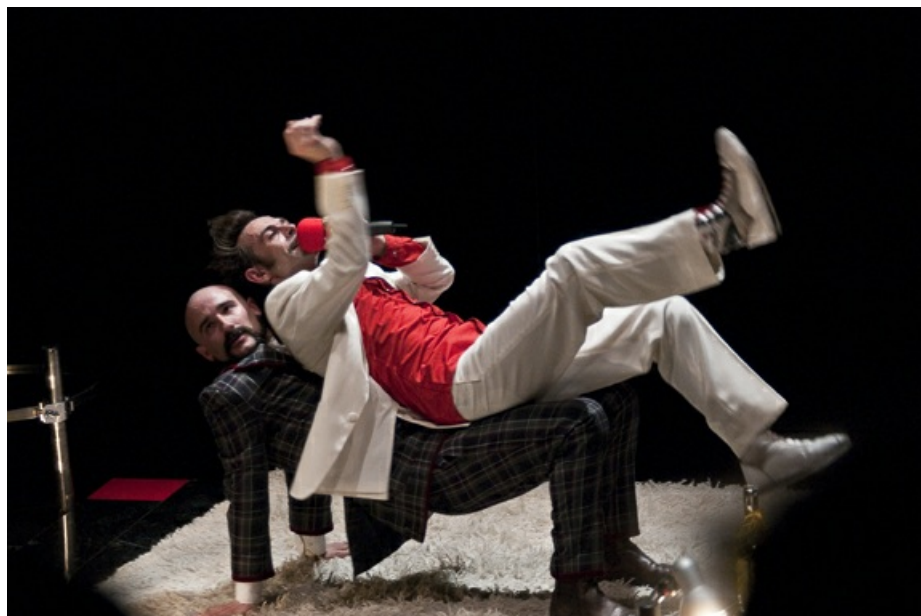
Mal menor (2010)