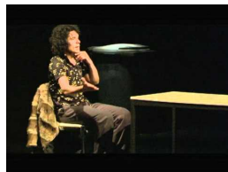
2003 Cronica de Jose Agarrotado