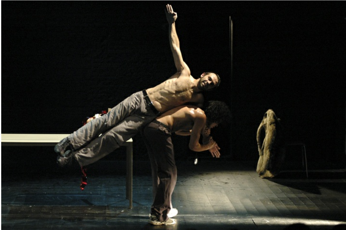
Crónica de José Agarrotado (2004)