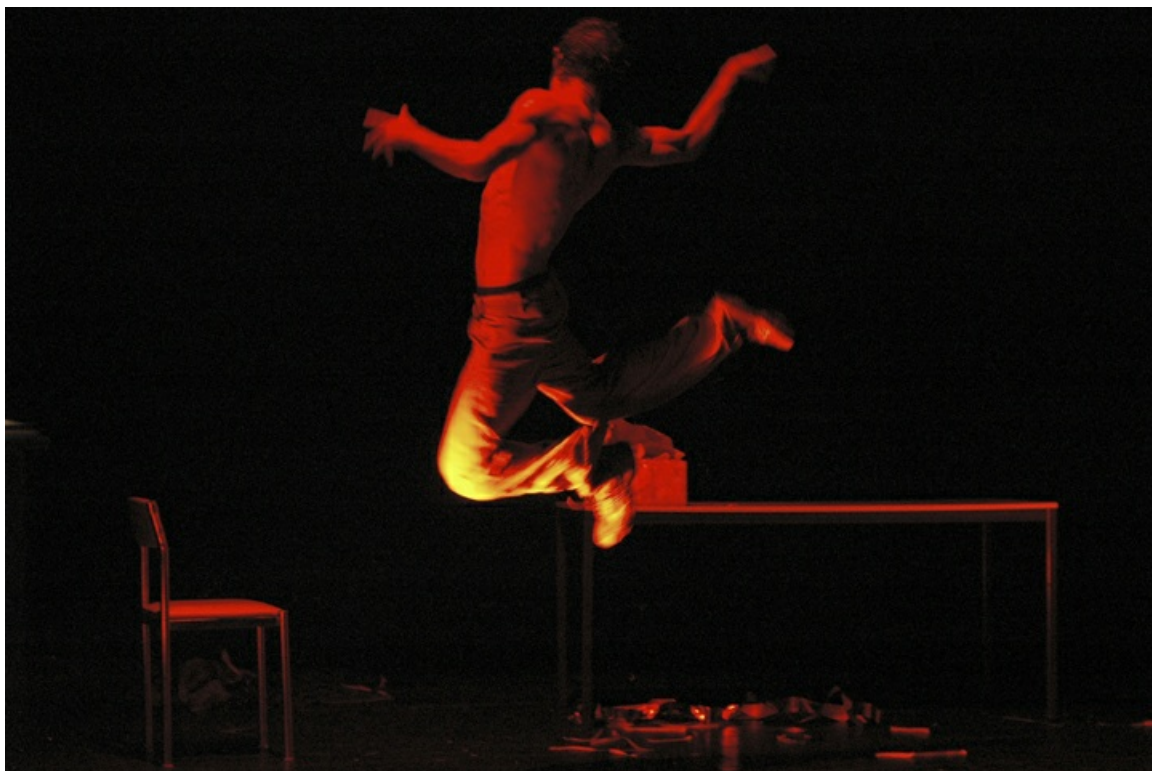
Crónica de José Agarrotado (2004)