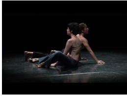
2009: Present vulnerable